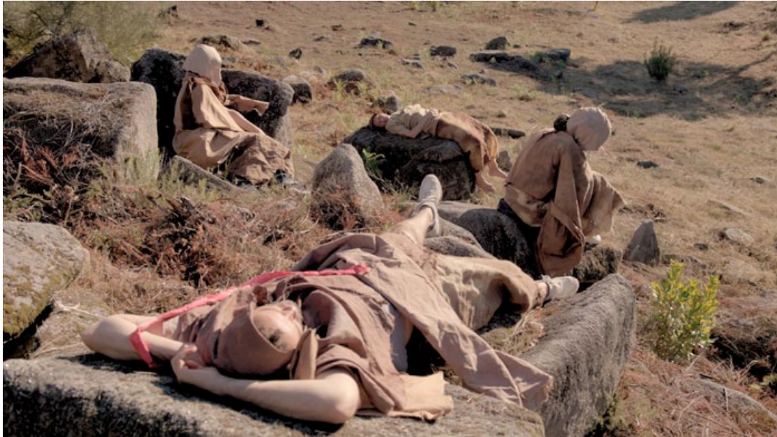
Ani Schulze, Flint House Lizard (Filmstill), 2019, 15 min